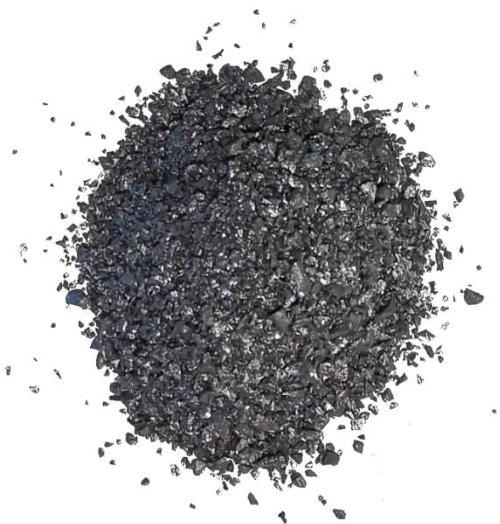
Рис. 2. Материал до измельчения