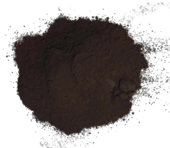
Рис. 3. Продукт измельчения